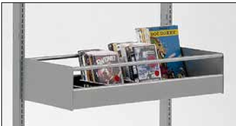
Enkelt krybbe, H20 cm med rør