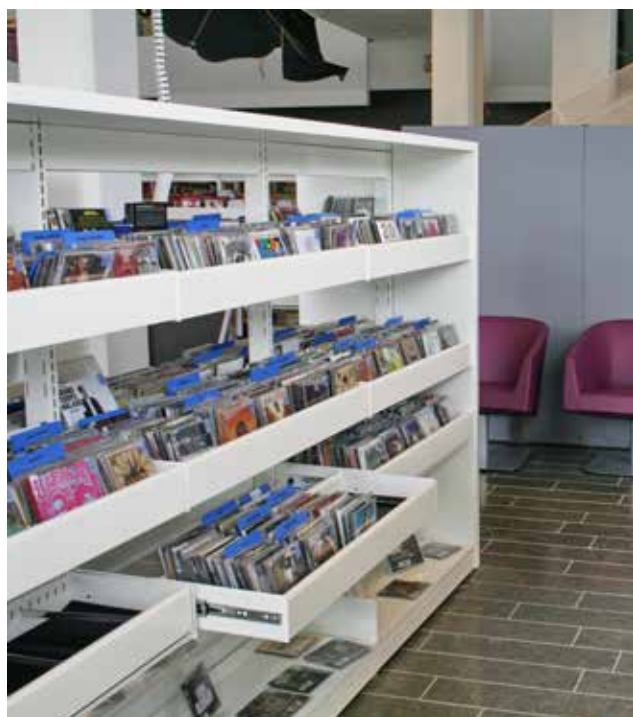
Enkelt krybbe, H10 cm uden rør.