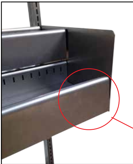
Dobbelt krybbe set forfra