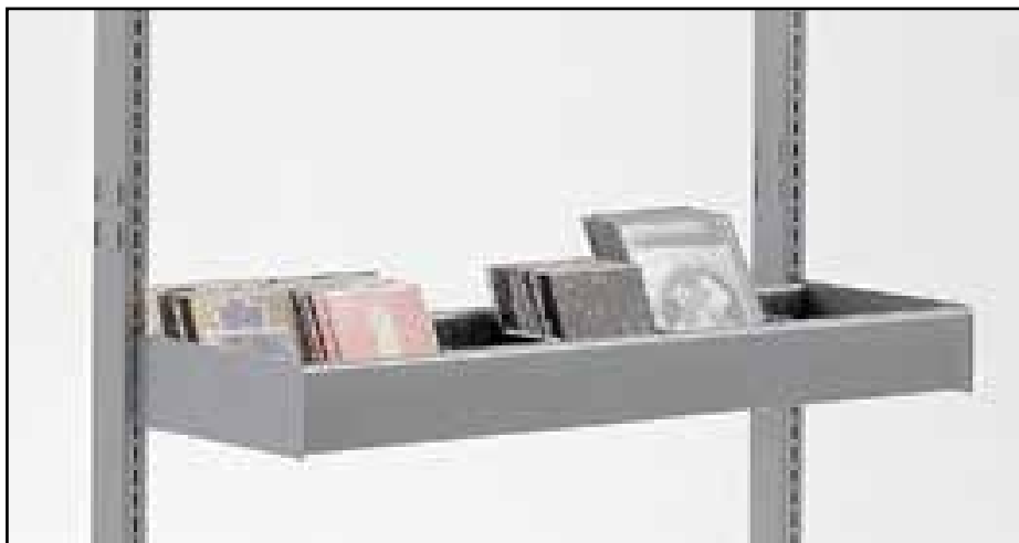
Enkelt krybbe, H10 cm uden rør.

Man kan indsætte en enkelt eller dobbelt krybbe i reolssystemer.