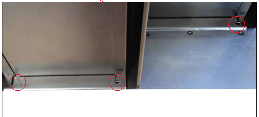
Dobbelt krybbe set nedefra