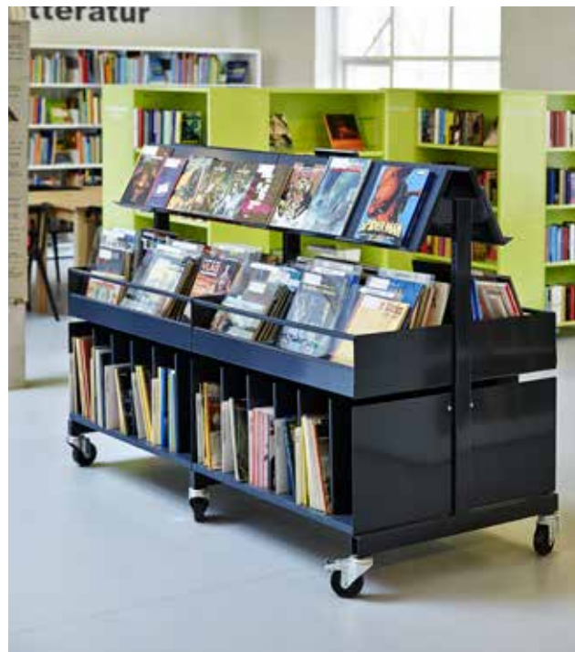
Enkelt krybbe, H20 cm med rør