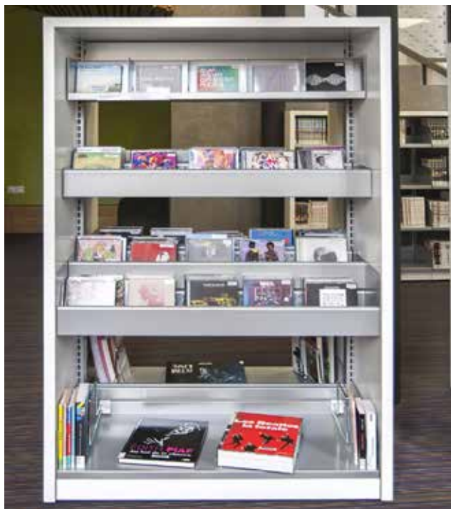
Enkelt krybbe, H10 cm uden rør og dobbelt krybbe, H20 cm uden rør