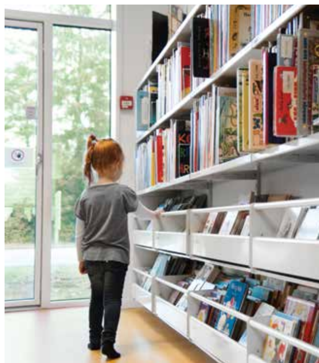
Enkelt krybbe, H20 cm med rør