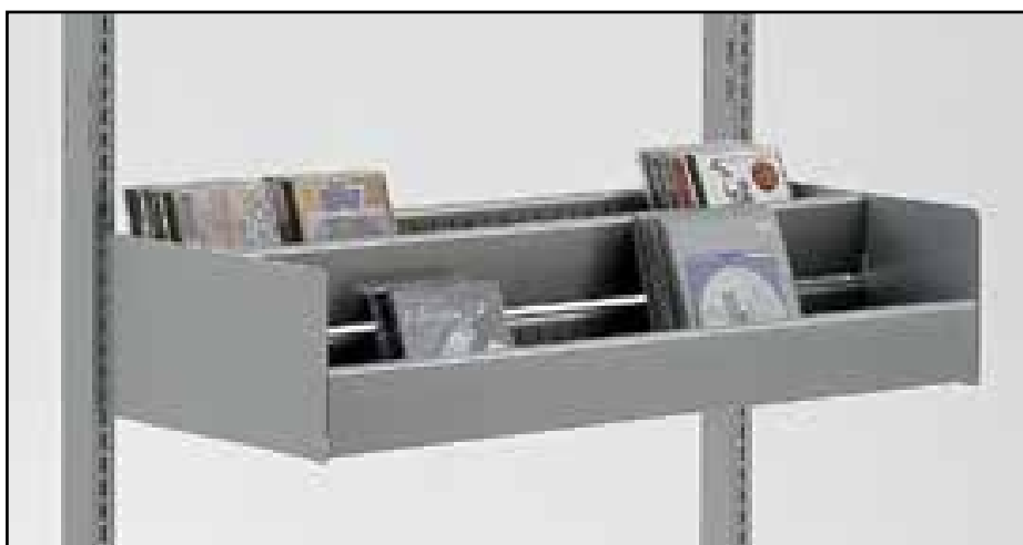
Dobbelt krybbe, H20 cm uden rør