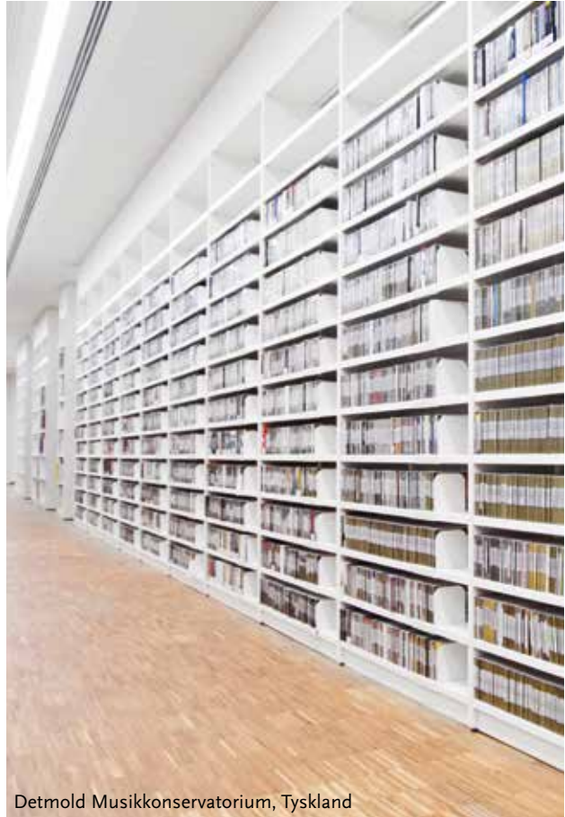
Detmold Musikkonservatorium, Tyskland