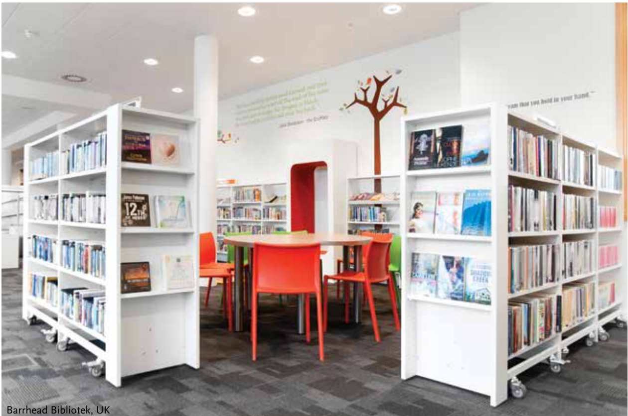
Barrhead Bibliotek, UK