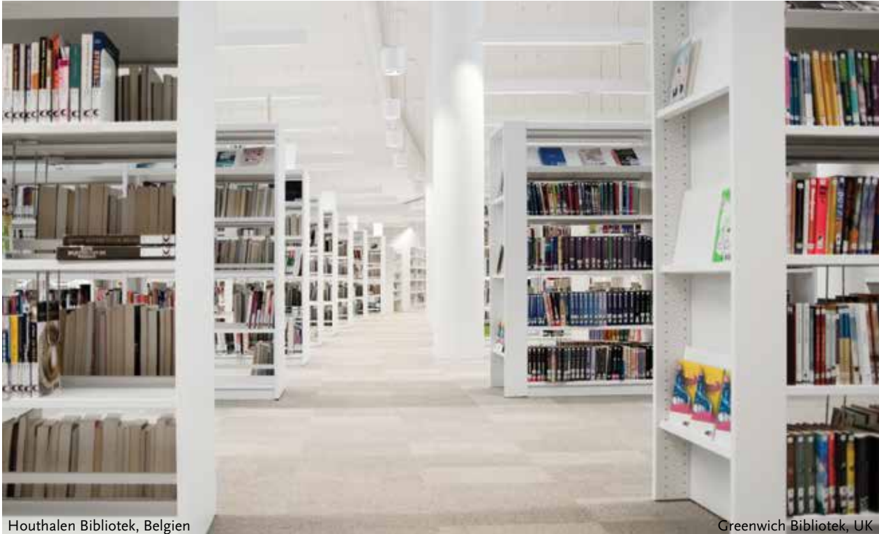
Houthalen Bibliotek, Belgien