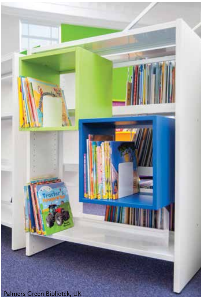
Palmers Green Bibliotek, UK