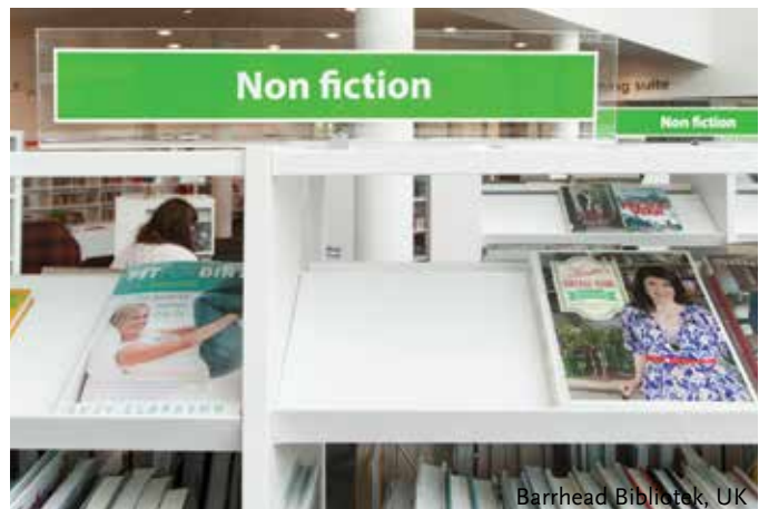
Barrhead Bibliotek, UK