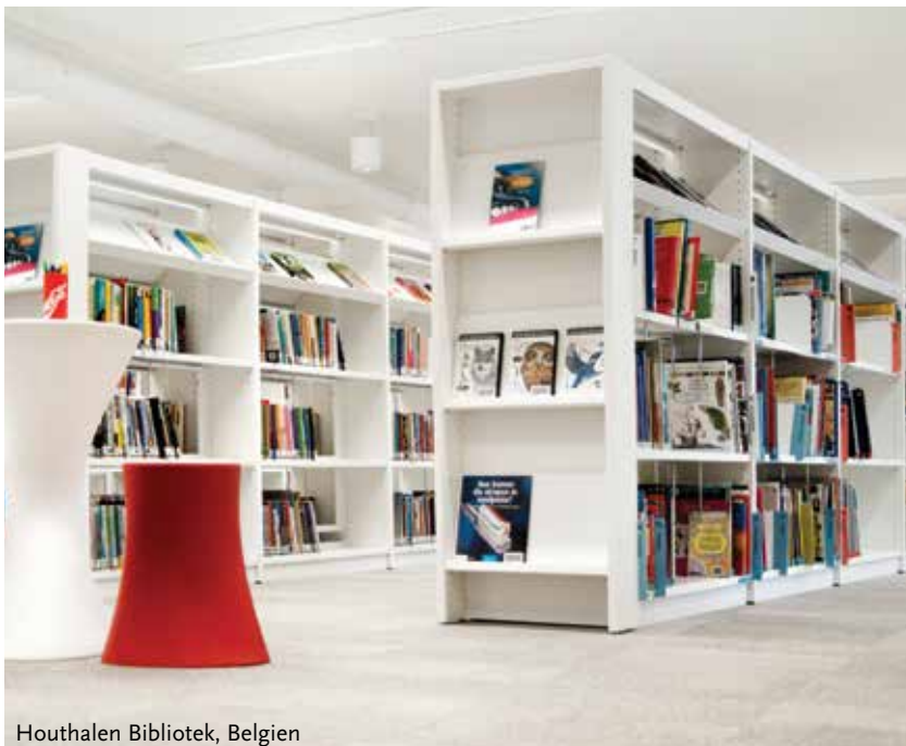
Houthalen Bibliotek, Belgien

For alle produktdetaljer og tekniske specifikationer på vores standardprodukter, henviser vi til vores hjemmeside www.lammultsbiblioteksdesign.dk .