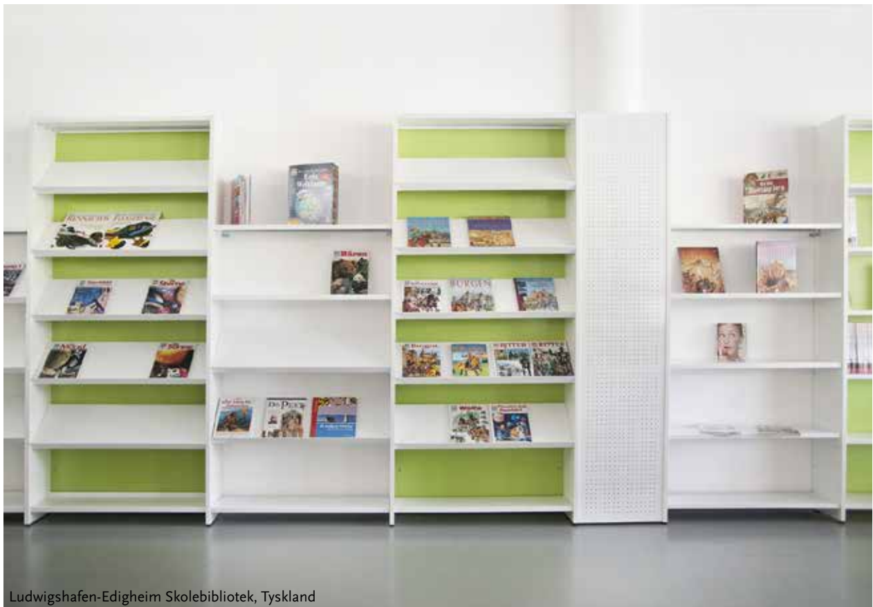
Ludwigshafen-Edigheim Skolebibliotek, Tyskland

Brug zoneinddeling til at skabe rum og nem navigation. Integrer belysning, skiltning, grafik og andre komponenter for et fuldent udtryk. Tilskynd "quick picks" med inspirerende udstillinger. Skab fristende læseområder og nem søgning med fritstående og integrerede krybber.