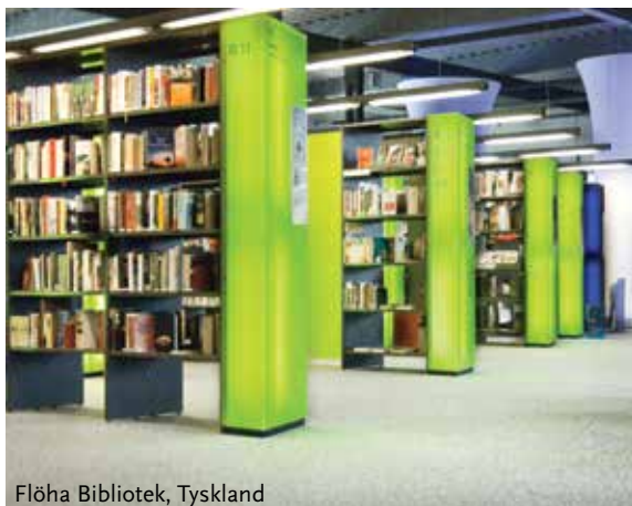
Flöha Bibliotek, Tyskland