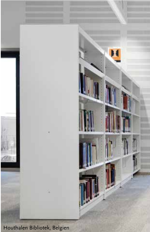
Houthalen Bibliotek, Belgien