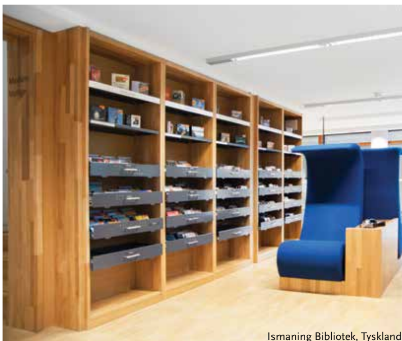
Ismaning Bibliotek, Tyskland

Biblioteker og deres design er vores passion og vores mission. Med engagement og nysgerrighed, erfaring og ekspertise skaber vi innovative, udtryksfulde og funktionelle løsninger til det moderne bibliotek.