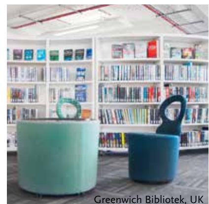
Greenwich Bibliotek, UK