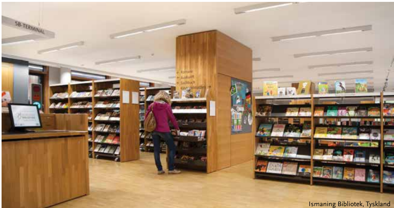
Ismaning Bibliotek, Tyskland

Fleksibelt og minimalistisk design. Moderne og bæredygtige løsninger. Varierende designudtryk. Faste og mobile enheder. Kombineret udstilling og opbevaring. Integreerede søgestationer og touch screens. Vi er ægte innovatører af moderne biblioteksdesign.