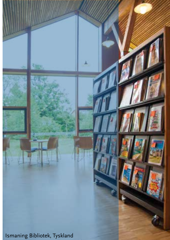
Ismaning Bibliotek, Tyskland