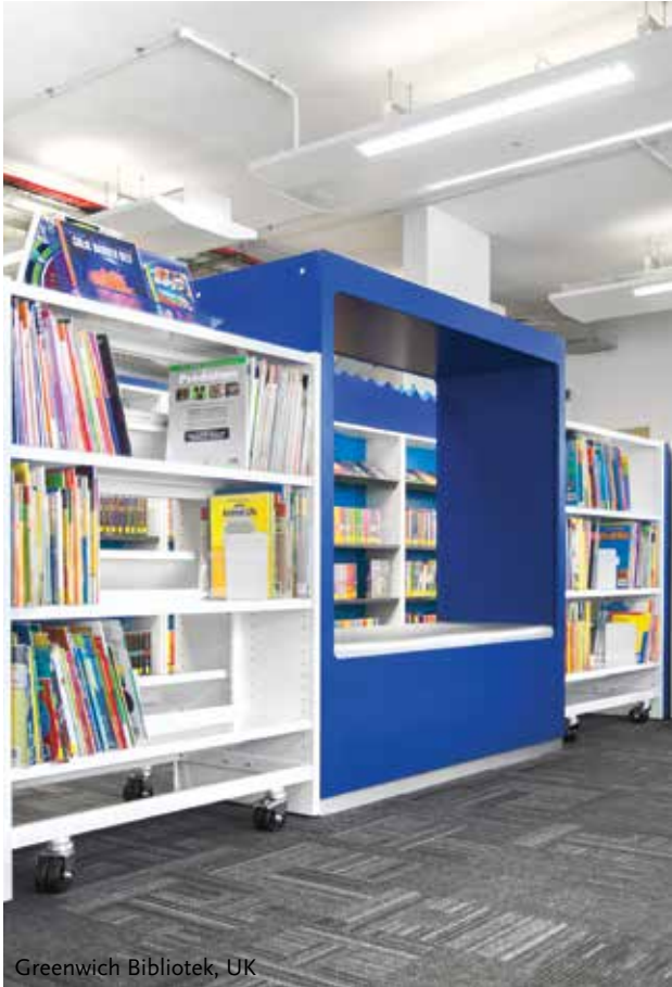
Greenwich Bibliotek, UK