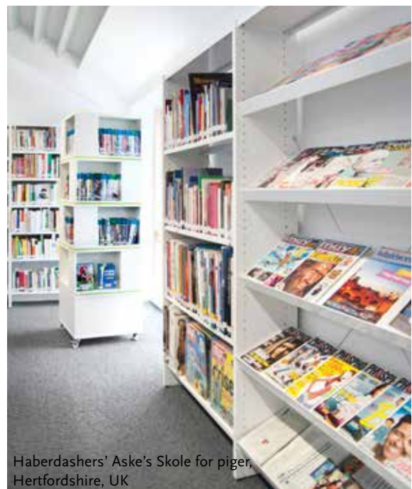
Haberdashers' Aske's Skole for piger, Hertfordshire, UK