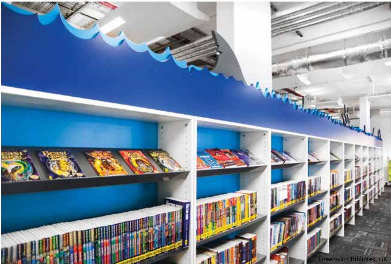
Greenwich Bibliotek, UK